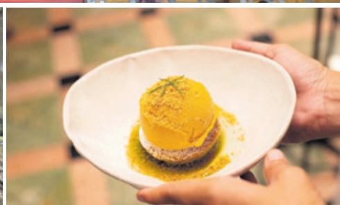
El objetivo principal de Essentially Mallorca es mostrar la isla como un territorio ecológicamente sostenible.